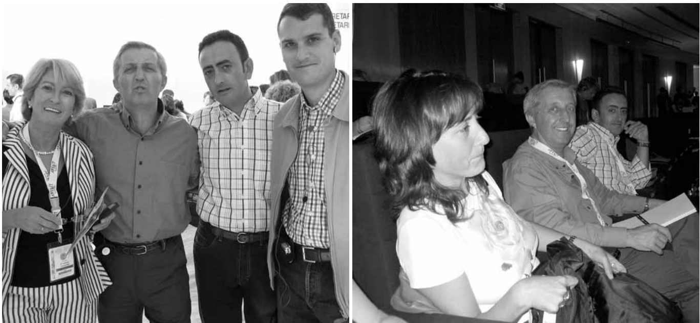
Asistentes al Primer Congreso Internacional de Enfermería Comunitaria

Por ello recibimos con ilusión las perspectivas de desarrollo de la Atención Primaria, recientemente anunciada por el gobierno, en el marco del acuerdo político firmado hace unos días para la financiación sanitaria.