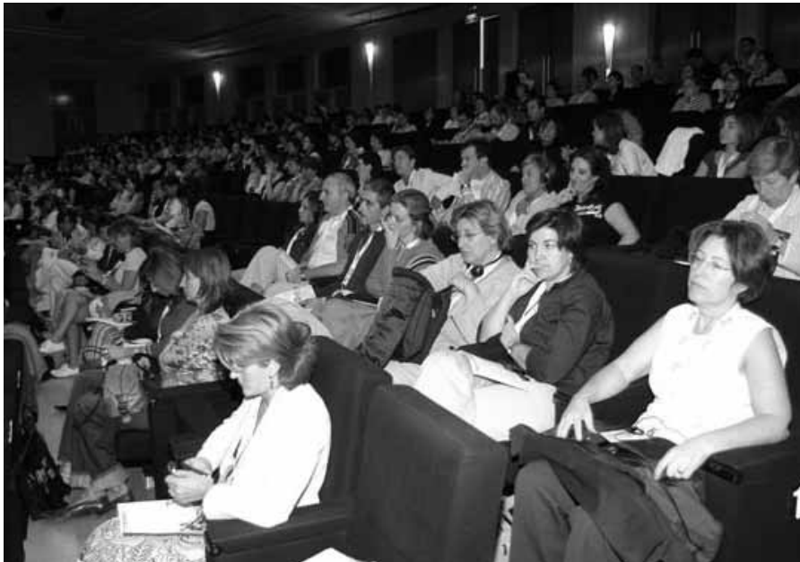
Asistentes al primer Congreso Internacional de Enfermería Comunitaria

nicas de localización y análisis de la información.